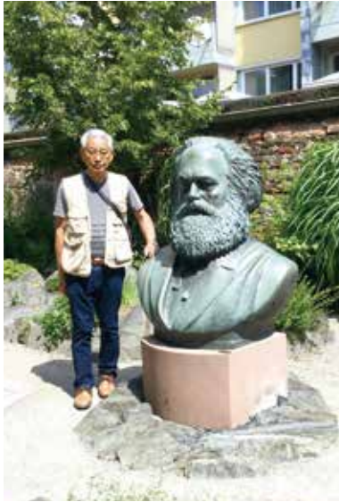
マルクスの生家の中庭

ったり、ツアーの送迎で時間が遅れてチケットの座席が家族バラバラになったりしたので一切旅行会社は使いませんね。