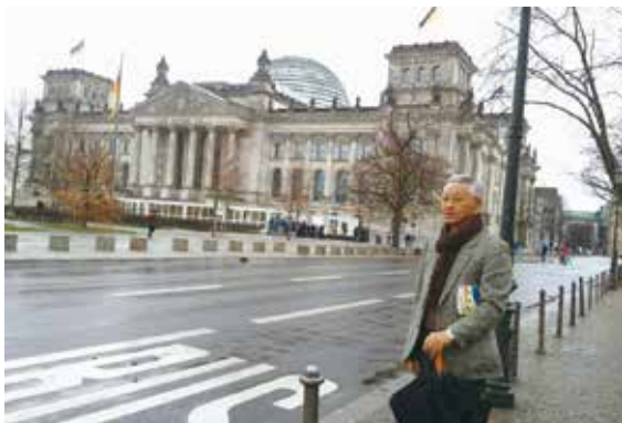
ドイツ連邦議事堂をバックに

東：今度、ギリシャに行こうと思っています。今年はコロナウイルスで怖いし出入国が制限されているから難しいけど、飛行機を予約して娘がルクセンブルグにいるのでそこに行ってそこから皆でギリシャに行こうと思って本も買っています。アカデマイアっていう古い学校の跡地がありソクラテスが教鞭揮ったところです。ルクセンブルグ行って二日か三日ぐらいギリシャに滞在する行程です。こういう情勢やから今年は無理ですね。旅が終わったら次の予定をします。飛行機やらみんなネットで予約して席まで取る。