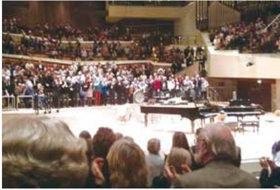
ベルリンフィルの舞台